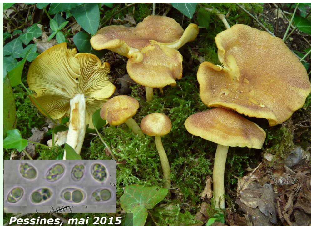
Pessines, mai 2015