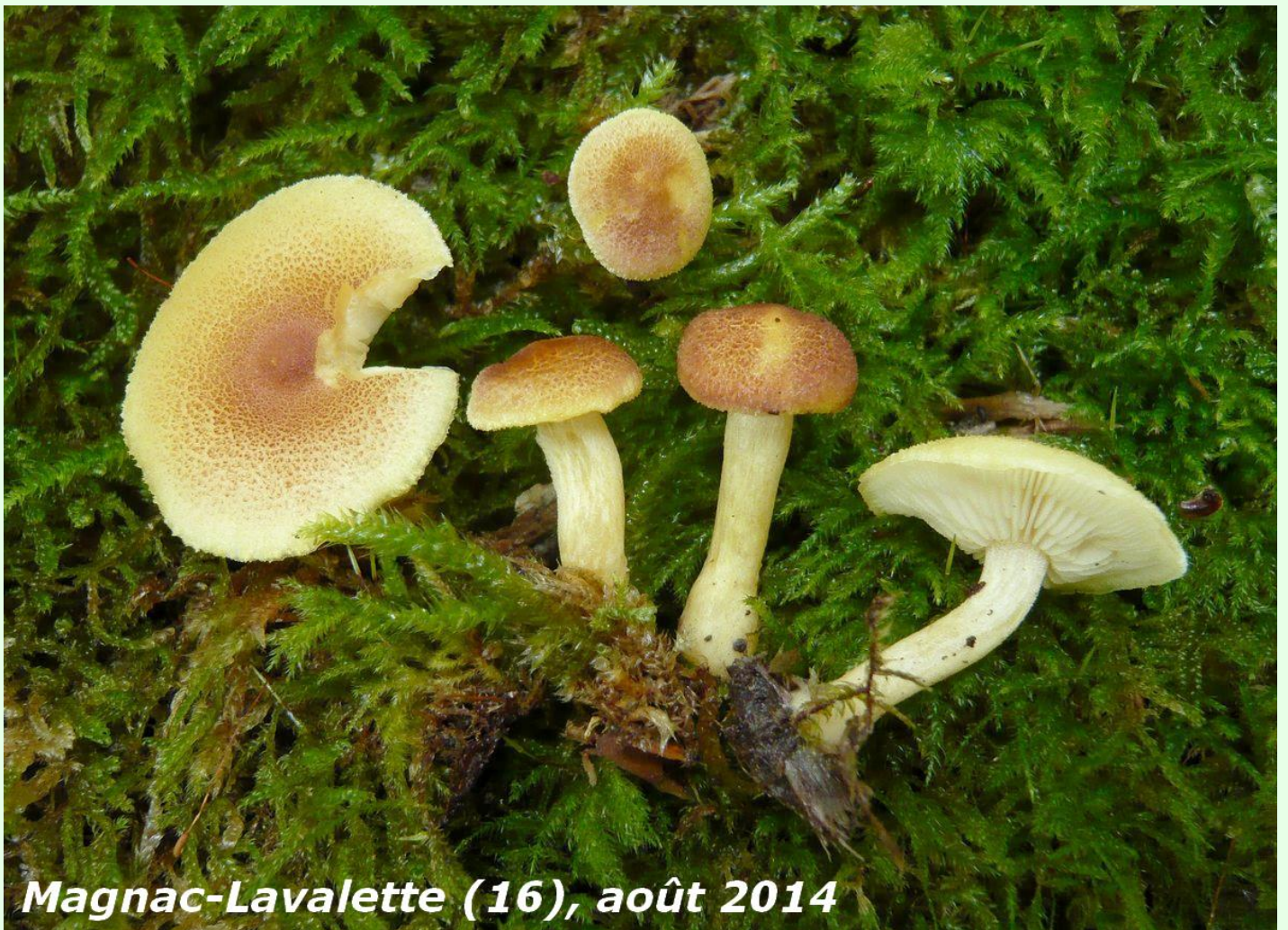
Magnac-Lavalette (16), août 2014