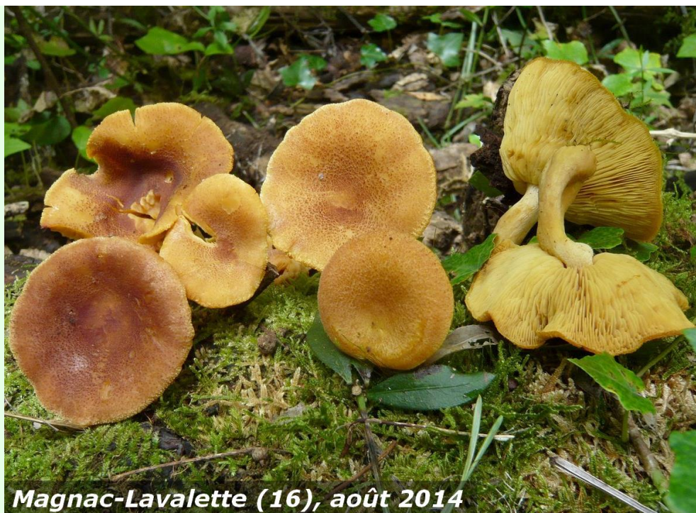
Magnac-Lavalette (16), août 2014