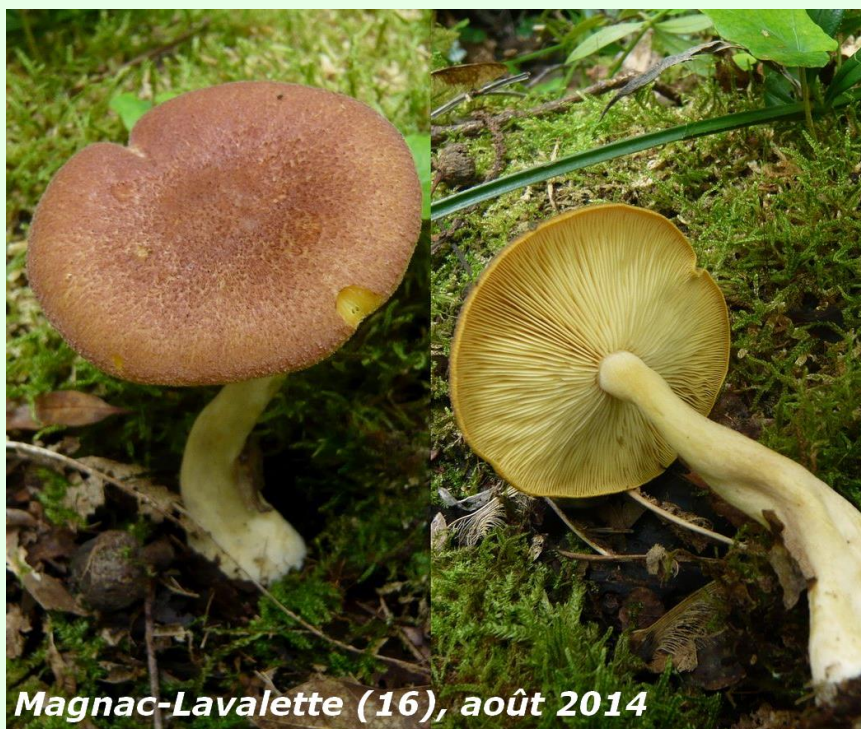
Magnac-Lavalette (16), août 2014